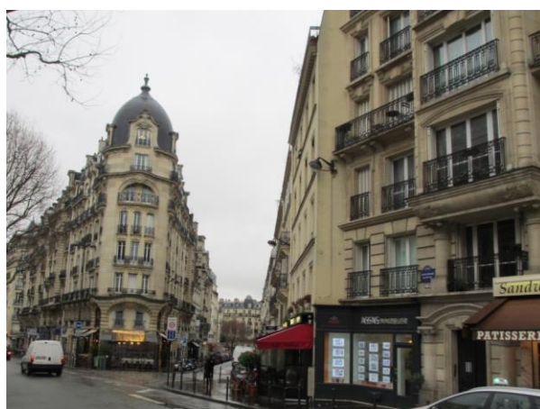
145 Boulevard Raspail - PARIS (6 e )