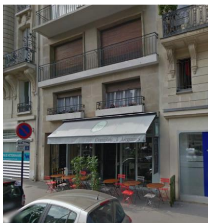
103 rue de Prony – PARIS (17 e )