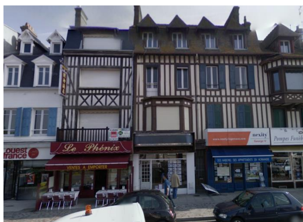
12 Boulevard Fernand Moureaux - TROUVILLE (31)