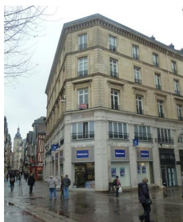
179 rue du Gros Horloge – ROUEN (76)