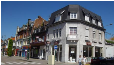
34 boulevard Emile Basly - LENS (62)