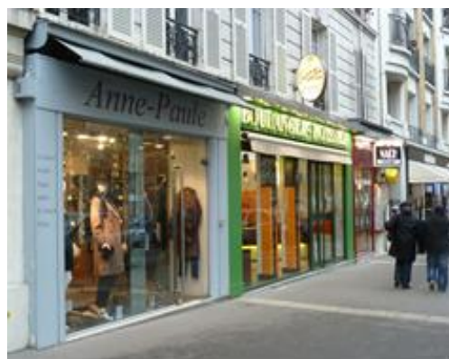
203 avenue Daumesnil PARIS (12 ème )