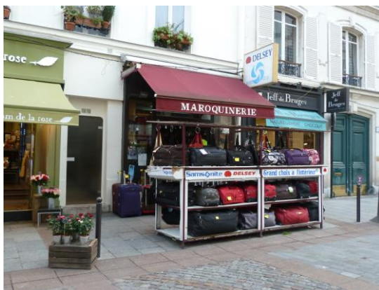
51 rue Cler PARIS (7 ème )

Au 31 décembre 2012, la dette bancaire d'IMMORENTE 2, répartie auprès de quatre établissements, s'élève à 9,1 millions d'euros. La part des emprunts à taux variable s'établit à 33,3 %. Tous les emprunts ont été souscrits à long terme, généralement 15 ans. Le coût moyen instantané de cette dette s'élève à 3,21 % contre 3,92 % au 31 décembre 2011.