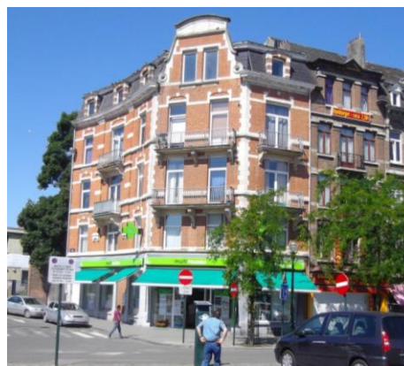
1/3 place Emile Bockstael BRUXELLES (Belgique)