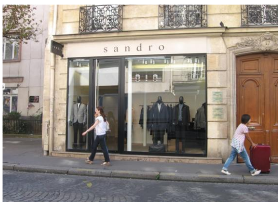
27/29 rue de Passy PARIS (16 ème )

(1) dividende brut avant prélèvement libératoire versé au titre de l'année N rapporté au prix de part acquéreur moyen de l'année N.