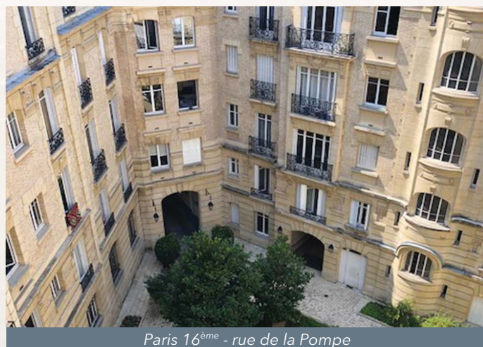
Paris 16 ème - rue de la Pompe