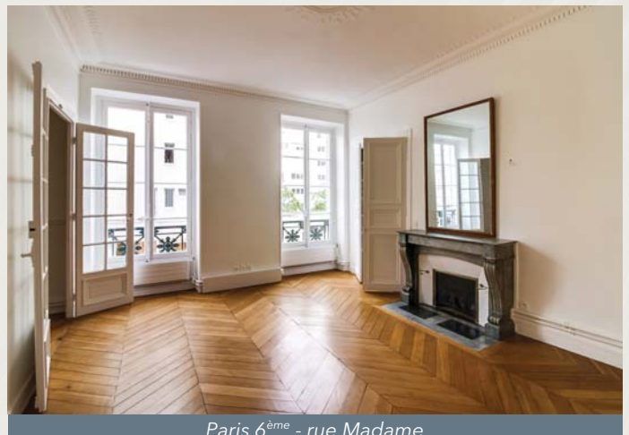
Paris 6 ème - rue Madame

Votre SCPI ne distribue pas d'acompte sur dividende ce trimestre.