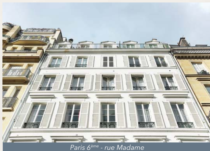
Paris 6 ème - rue Madame