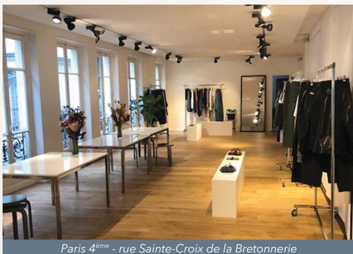
Paris 4 ème - rue Sainte-Croix de la Bretonnerie

(1) HAB (Habitation); CCV (Commerce de centre-ville)