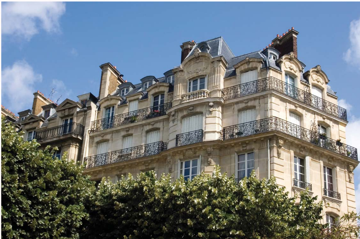
Photographie illustrant la cible d'investissement, à titre d'exemple, et ne préjugant pas des investissements futurs.