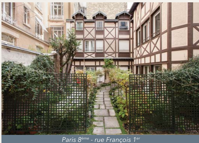
Paris 8 ème - rue François 1 er

Vous pouvez par ailleurs retrouver le bulletin trimestriel d'information, les statuts et la note d'information sur le site internet de la Société de Gestion ( www.sofidy.com ).