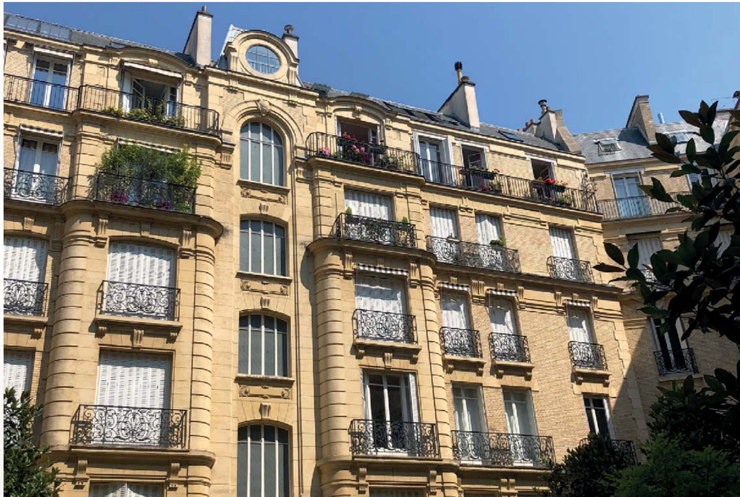
Paris 16 ème - Rue de la Pompe

Exemple d'investissement ne préjugant pas des investissements futurs