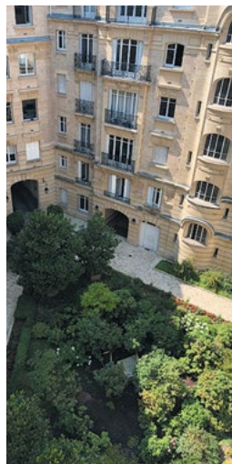
Rue de la Pompe, Paris 16 e

Photographies concernant des investissements déjà réalisés, à titre d'exemple, mais ne constituant aucun engagement quant aux futures acquisitions de la SCPI.