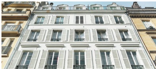
Rue Madame, Paris 6 e