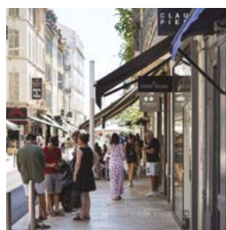
Rue Commandant André, Cannes (06)