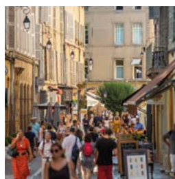
Rue d'Italie - Aix-en-Provence (13)

Photographies concernant des investissements déjà réalisés, à titre d'exemple, mais ne constituant aucun engagement quant aux futures acquisitions de la SCPI.