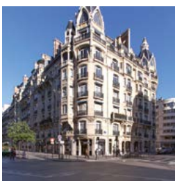
Rue de Courcelles, Paris 17 e