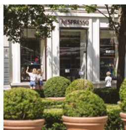
Place de la Bourse, Lyon 2 e

Photographies concernant des investissements déjà réalisés, à titre d'exemple, mais ne constituant aucun engagement quant aux futures acquisitions de la SCPI.