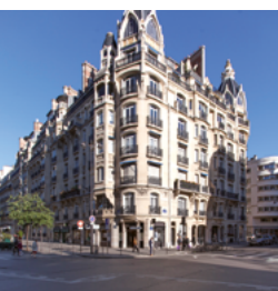
Rue de Courcelles, Paris 17 e