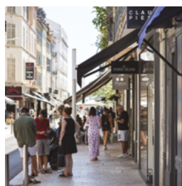
Rue Commandant André, Cannes (06)