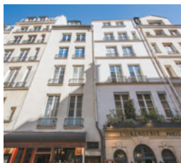
Rue Saint-Louis en l'Île, Paris 4 e