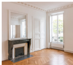
Rue Madame, Paris 6 e