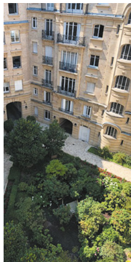
Rue de la Pompe, Paris 16 e

Photographies concernant des investissements déjà réalisés, à titre d'exemple, mais ne constituant aucun engagement quant aux futures acquisitions de la SCPI.