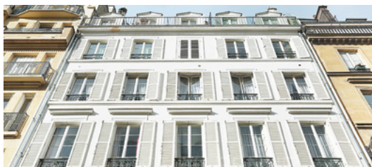
Rue Madame, Paris 6 e