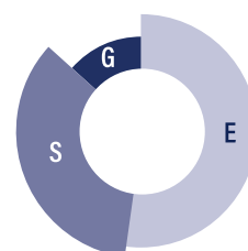
RÉPARTITION DU NOMBRE DE CRITÈRES PAR PILIER