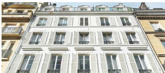
Rue Madame, Paris 6 e