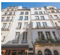
Rue Saint-Louis en l'Île, Paris 4 e