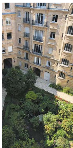
Rue de la Pompe, Paris 16 e

Photographies concernant des investissements déjà réalisés, à titre d'exemple, mais ne constituant aucun engagement quant aux futures acquisitions de la SCPI.