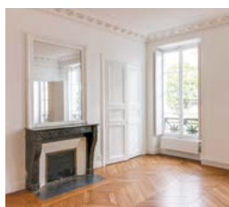
Rue Madame, Paris 6 e