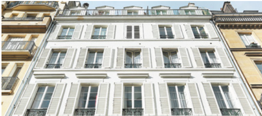
Rue Madame, Paris 6 e