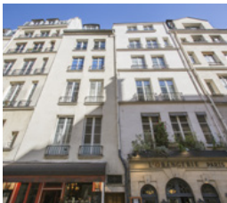
Rue Saint-Louis en l'Île, Paris 4 e